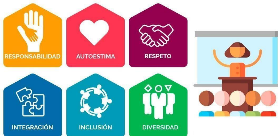
Figura 1: Principio y Valores educativos formativos.