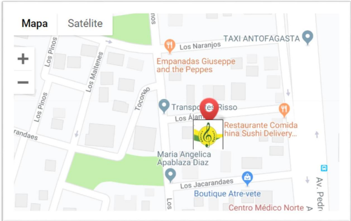
Figura 3: Ubicación.

Colegio mi Hijo 2, se encuentra ubicado en Los álamos # 268 , sector norte de la ciudad de Antofagasta entre las Calles: Los Álamos, por el Norte; Los Jacarandaes por el Sur; Los Manzanos por el Poniente y Avenida Presidente Pedro Aguirre Cerda por el Oriente.